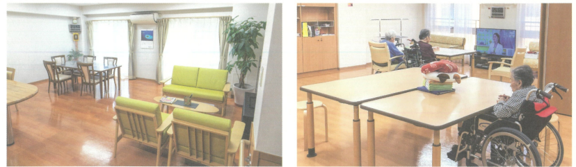
●都市型軽費老人ホーム(共同生活スペースの様子) 家庭環境、住宅事情などで在宅での生活が困難な方に、低額な料金でサービスを提供しております。