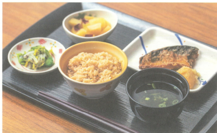
●日常の食事の一例

季節に合わせて、その時期の旬を考えながら、食事はすべて施設内で調理し、日々の食事を提供しております。