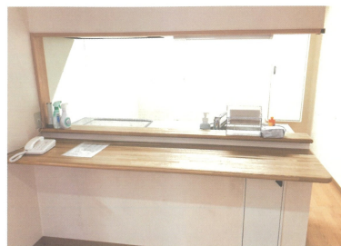
●様々なイベントで活用できるように、地域交流スペース内にキッチンを整備しております。

ユニットは入居者様個人のプライバシーが守られた「個室」と、他の入居者様や介護スタッフと交流するための「居間」で構成されています。一人ひとりの個性や生活リズムにに応じて暮らしていけるユニットケアを365日・24時間体制の安全・安心を実現しています。パブリックスペースとして防災拠点型地域交流スペースを設けており、災害時の避難所や地域のイベントにも活用可能です。