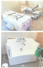
●入居者様の状態に合った入浴設備で対応しております。

各ユニットに座ったまま入浴が出来入浴設備を設置し、寝たままでも入浴出来ない方には機械浴槽で対応しております。