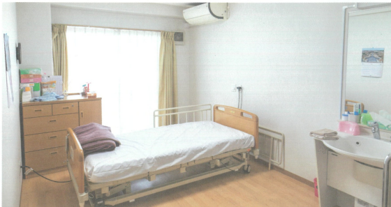
●居室の一例(思い出の品を持ち込み、自分なりの空間にアレンジ)

施設の個室で生活していても自宅で生活しているように感じてもらう為に、自宅で使用していた物を配置し、それぞれ思い思いの時間をお過ごしいただけます。