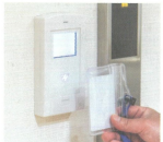
●カードキーをかざすとロックが解除される仕組みで施設内のセキュリティを高めています。

施設の要所にカードリーダーを設置し、不審者の侵入を防ぐだけではなく、入居者様の無断離園などを防ぎます。