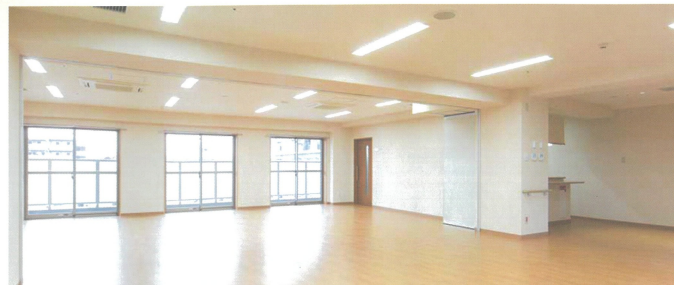
●地域交流スペース(災害時は防災拠点として活用します)

特別養護老人ホーム生寿園は靴谷駅から徒歩5分の交通の利便性が高い場所にあります。