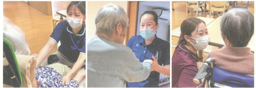
●入居者様とのコミュニケーションを大切にしながら、入居者様に寄り添ったケアに取り組んでいます。