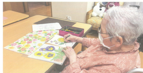
●ショートステイ(個人活動の様子) 入居者様がやりたい事や興味のある事に取り組んでいただいております。

わたしたち生寿園は、「友情を育み、生きる喜びと希望を育み、安全・安心・信頼の介護を実現します」を理念として掲げています。 この理念を実践し、看取るその瞬間までその人らしさを尊重し、ケアにあたっております。