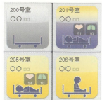
●リアルタイムモニター 常に入居者様の様子を把握することができます。

体動(寝返り、呼吸、脈拍など)をセンサーで測定し、睡眠状態・呼吸状態を24時間リアルタイムで把握出来る見守り支援システムを全居室に設置しています。 睡眠状態を把握することにより、覚醒したタイミングでケアを行う事ができます。また、呼吸・脈拍の変化を把握し、一定の変動があった場合は通知する設定にすることで、体調変化を推察する事が出来ます。