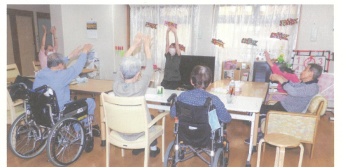
●ショートステイ(ユニット体操の様子) 「ショートステイは在宅生活の延長である」をコンセプトに家庭で過ごす感覚を大切に、個人の趣味・趣向にあったレクリエーションをご用意しております。